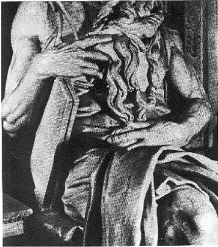
(detalle de El Moisés de Miguel Angel)